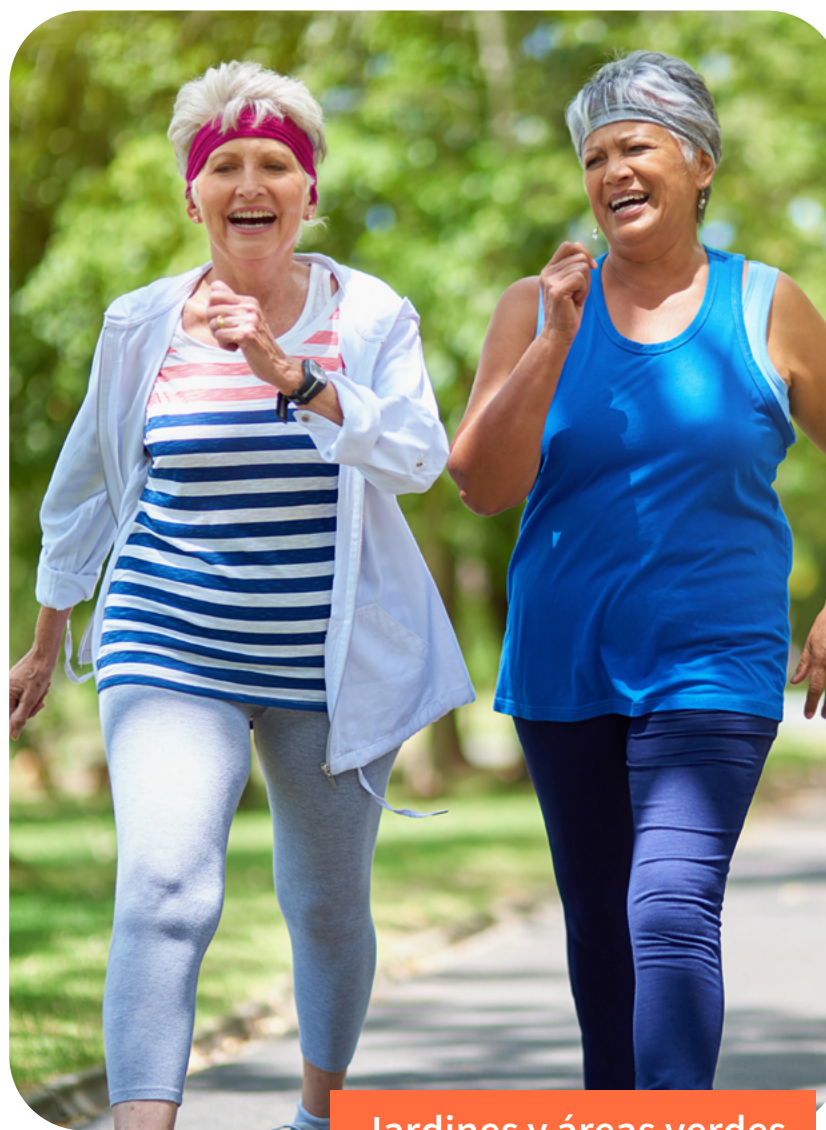
Jardines y áreas verdes