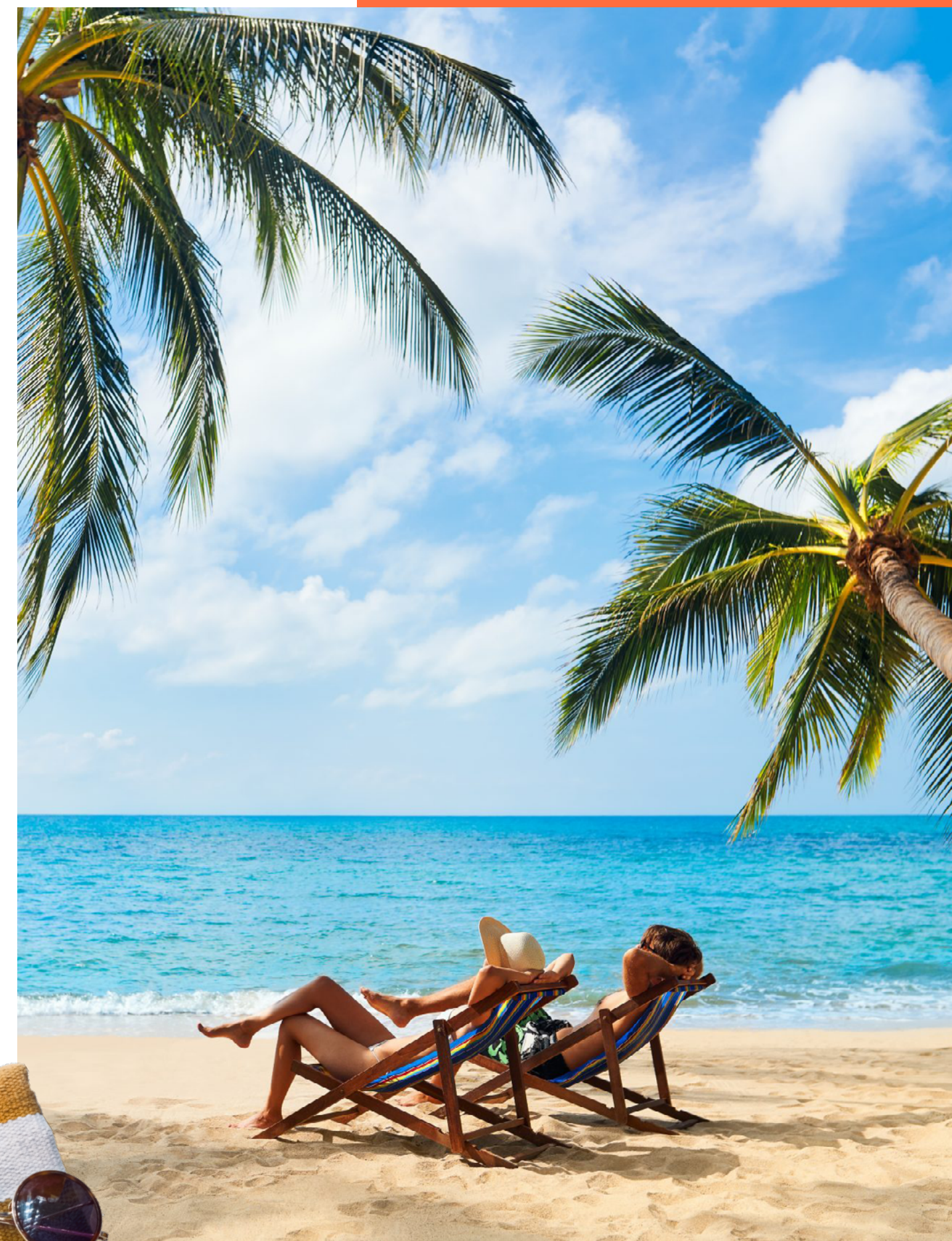
A minutos de la playa