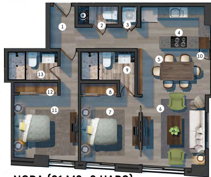
NORA (91 M2- 2 HABS)