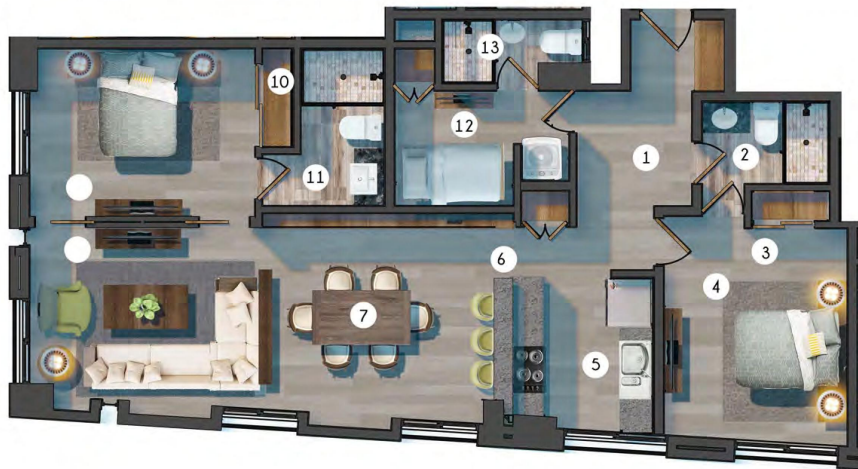
LIV (112 M2- 2 HABS)